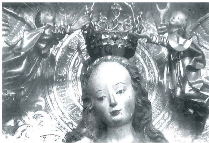
Fragment rzeźby z szafy ołtarzowej. Zaginiona korona i figury aniołków. Stan sprzed 1945 r.

iz wie, gdzie jest przechowywana zabytkowa figura św. Grzegorza, która zaginęła w czasie ostatniej wojny. Niestety, nie zdołano dokonać dalszych ustaleń i rozmówca ponownie już nie zadzwonił 17 . Natomiast w tym roku okazało się, iż fragment płaskorzeźbionej sceny Bożego Narodzenia , pochodzący ze skrzydła wewnętrznego polipptyku, znajduje się w zbiorach Ostpreussisches Landesmuseum w Lüneburgu 18 w Niemczech.