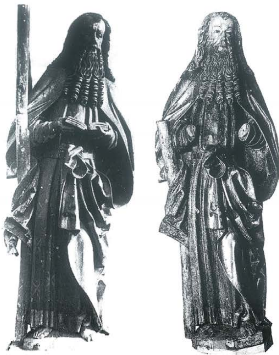
Rzeźba św. Andrzeja, która prawdopodobnie pierwotnie znajdowała się na zwieńczeniu szafy poliptyku. Stan przed 1945 r. (po lewej) i z 1986 r. (po prawej). Obecnie w zbiorach Muzeum Warmii i Mazur w Olsztynie

Płaskorzeźbione sceny z życia Marii, pochodzące ze skrzydeł bocznych, początkowo przechowywane były w kościele w Pierzchałach, a po pożarze tego kościoła część z nich przewieziono do Chruściela. Wówczas, w roku 1954 12 były tam jeszcze pełne kwatery ze scenami: Zwiastowania , Nawiedzenia , scena Pokłonu