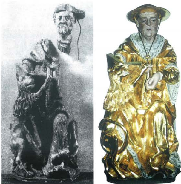
Figura św. Hieronima. Zniszczenia po II wojnie światowej: stan z 1956 r. i po konserwacji w 1993 r.

kierunkiem K. Steinbrechta 7 uzupełniono brakujące rzeźby 8 i płaskorzeźby, przemalowano także nieco sceny na skrzydłach. Po zakończeniu prac w 1907 r. ołtarz wstawiono do nawy północnej w jej części zachodniej 9 . W tym miejscu dotrwał do II wojny światowej.