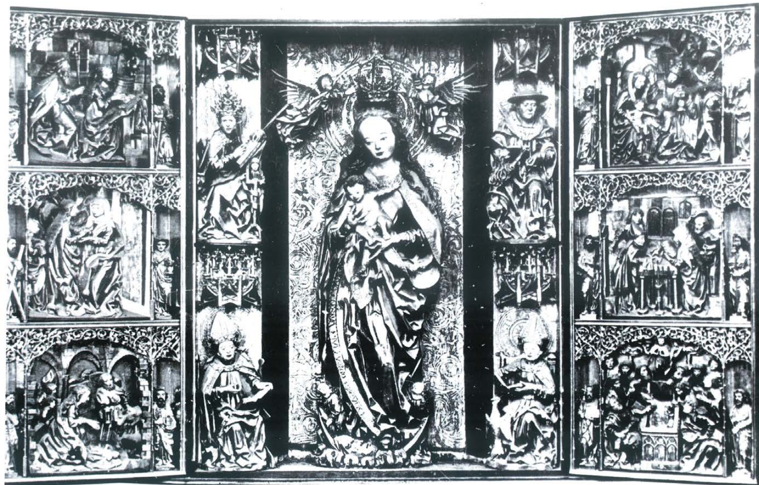
Polptyk fromborski z 1504 r. - stan przed 1945 r.