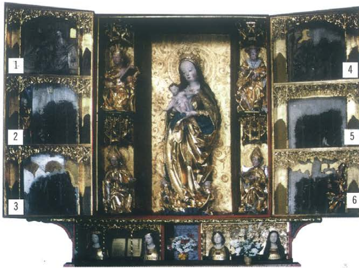
Ogólny widok ołtarza obecnie: w części centralnej Madonna z Dzieciątkiem , kwatera 1 — Zwiastowanie (uszkodzona), kwatera 2 — Nawiedzenie (zachowana szczątkowo), kwatera 3 — Boże Narodzenie (zaginiona), kwatera 4 — Pokłon Trzech Króli (uszkodzona), kwatera 5 — Ofiarowanie w świątyni (zaginiona), kwatera 6 — Wniebowzięcie (zachowana szczątkowo)

Początkowo, przez prawie 250 lat, poliptyk umieszczony był w prezbiterium i pełnił rolę ołtarza głównego. W tym okresie kanonikiem kapituły warmińskiej był przez ponad 40 lat (1497-1543) 4 Mikołaj Kopernik. Jest to więc także jeden z niewielu zabytków związanych bezpośrednio z osobą wielkiego uczonego. W czasie I wojny szwedzkiej w 1626 r., kiedy grabieżcy zniszczyli lub wywieźli wiele przedmiotów z wyposażenia kościoła 5 ołtarz główny ocalał, ale został uszkodzony. Krótko po zakończeniu wojny kapituła zabrała się do naprawiania szkód i fundowania nowych ołtarzy. W sztuce obowiązywał już barok, który stosował inne formy dekoracyjne, a powstające nowe ołtarze prezentowały się bardziej okazałe. Wykonywano je nie tylko z drewna, ale także